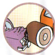
НАЕЗД НА СТОЯЩЕЕ ТРАНСПОРТНОЕ СРЕДСТВО