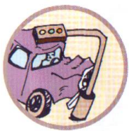
НАЕЗД НА ПРЕПЯТВИЕ