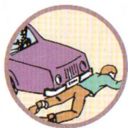
НАЕЗД НА ПЕШЕХОДА