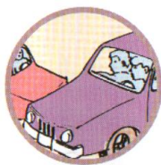
СТОЛКНОВЕНИЕ ТРАНСПОРТНЫХ СРЕДСТВ